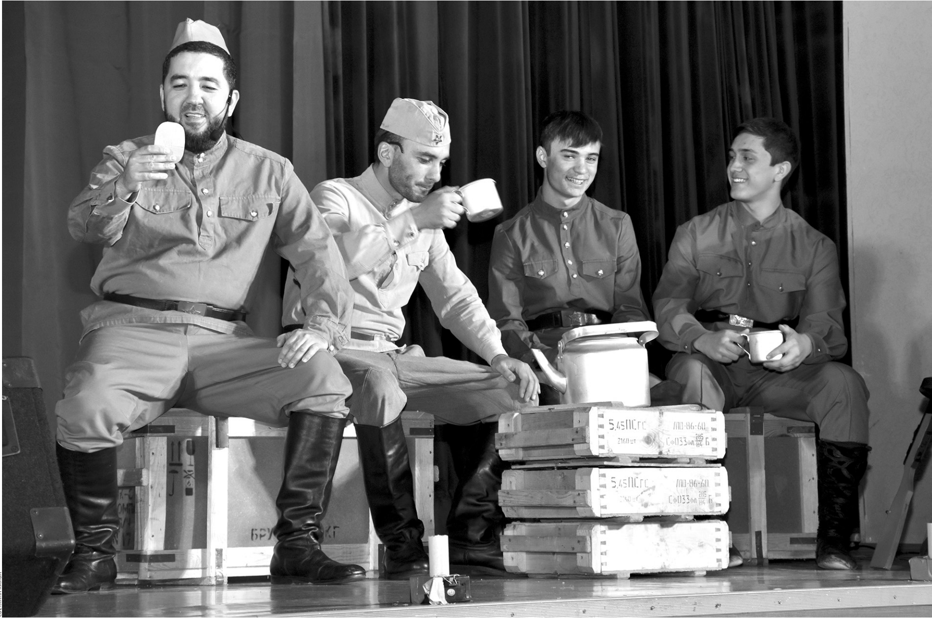
Отчетный концерт творческих коллективов Хабезского районного отдела культуры

специальными гостями отчетных концертов стали действующие участники СВО, которые тоже были представлены творственно, им было уделено особое внимание.